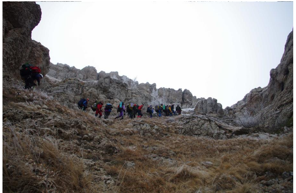
Фото 3 – Рух групи перед виходом на яйлу