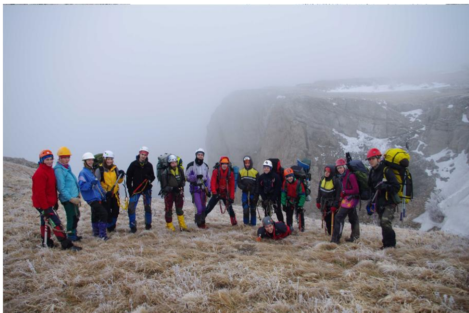
Фото 7 – Група на перевалі