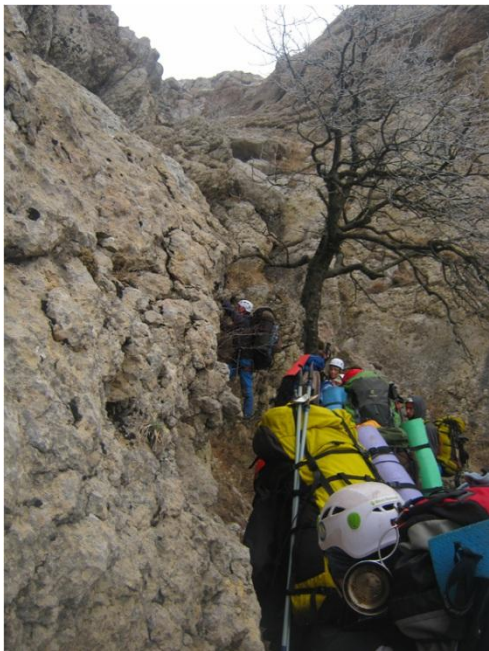
Фото 4 – Подолання сходинки