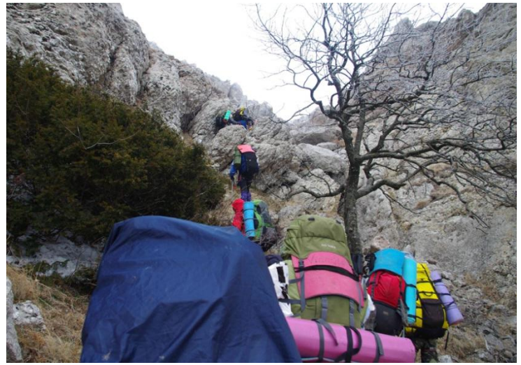
Фото 3 – Рух вгору по кулуару