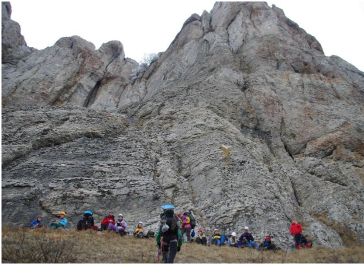
Фото 2 – Група на полиці перед входом в перевальний кулуар